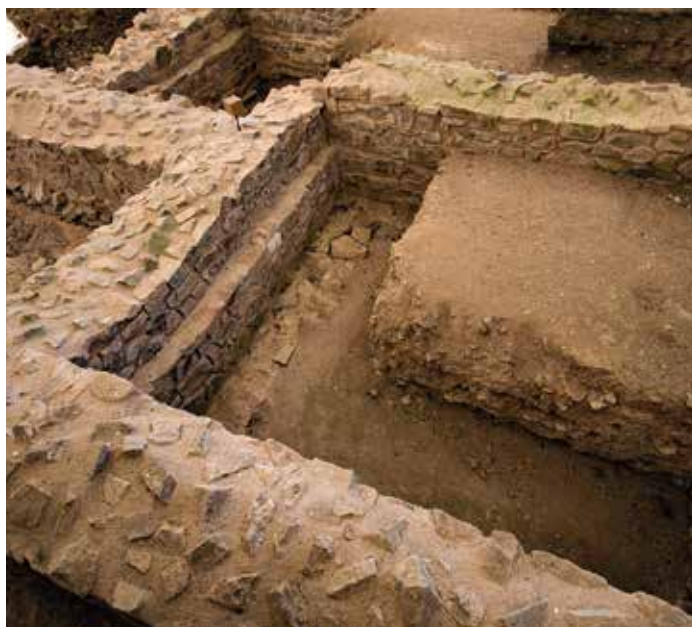
Rapport d'activité 2021

L'association poursuit avec enthousiasme et détermination sa volonté de faire voyager tous les publics dans l'histoire humaine grâce à ses activités ludiques et